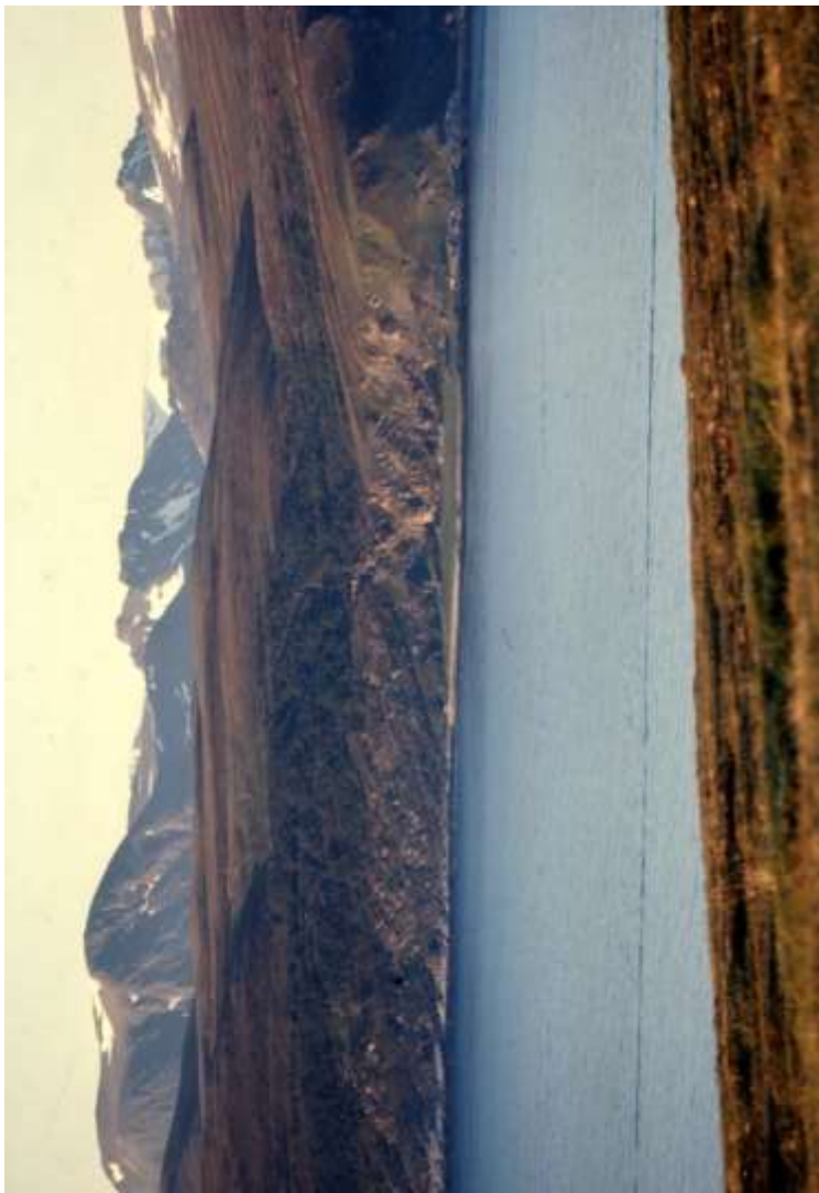
Løksletta sett med telobjektiv fra Mønnes på Loppa øy.