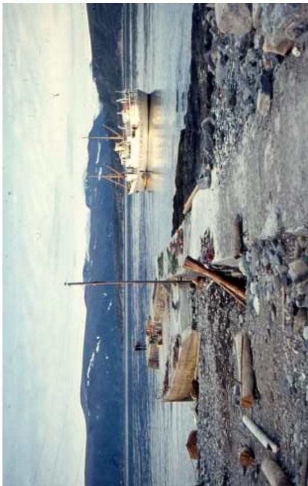
Lokalbåten anløper Loppa øy på 1960-talet.

Hval- og selfangst har det ikke vært mulig å bedrive rundt Loppa. Noen deltok som mannskap på fangstskuter men sådan jakt har ikke bedrevets lokalt.