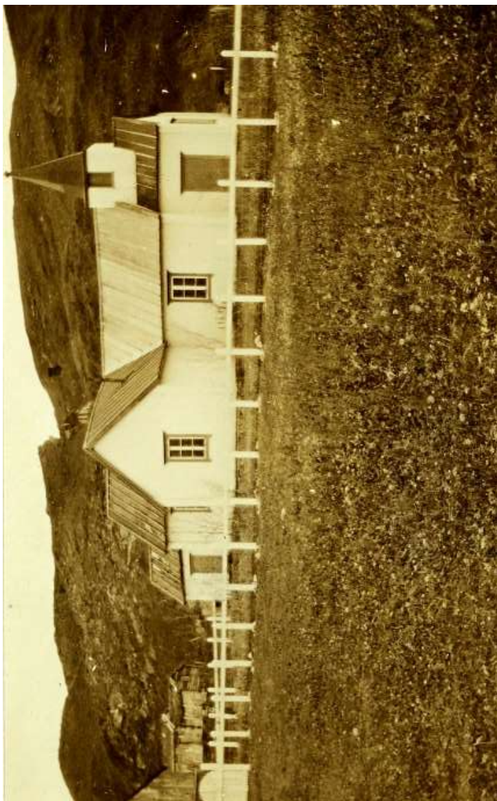
Den gamle Loppa kirke

Samfunnet bygde jo i grunnen på at alle dro sitt strå til stakken og at man hjalp hverandre når det behøvdes. Ingen fikk svikte.