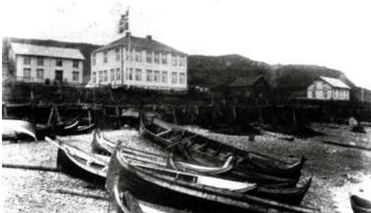
Kjøpmannens hus ca 1910 og skolen..