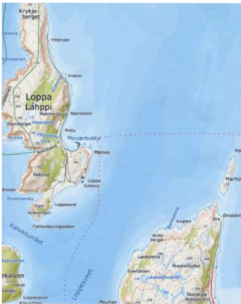
Kart over Loppa og fastlandet innenfor, med blant annet Løksletta og Bankekjeilen