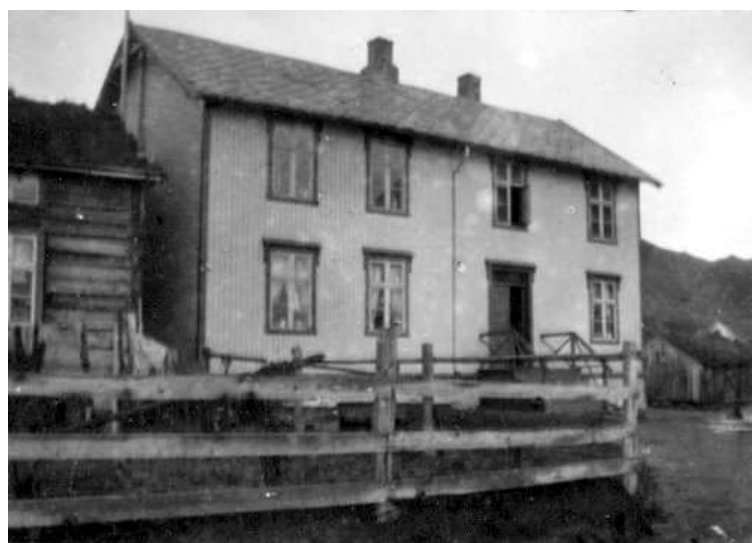
Loppa Skole omkring 1910.